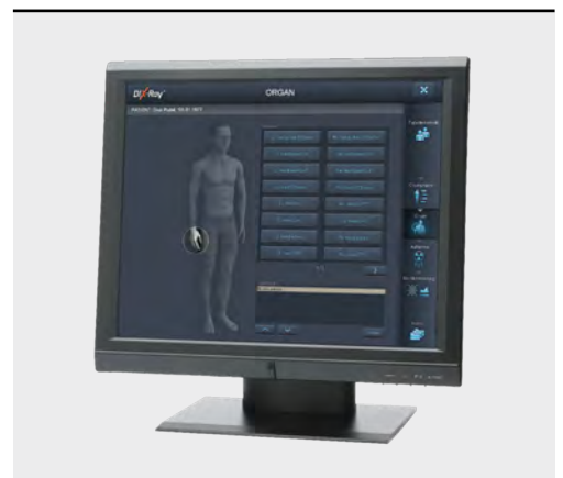
Die AQS-Aufnahmekonsole des EXAMION FLEXIBLE-FPS Systems vereinfacht die Bedienung durch die intuitive Touchscreen-Benutzeroberfläche.